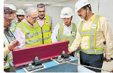
एनएचएसआरसीएल के प्रबंध निदेशक सुरत में निर्माण कार्य का निरीक्षण करते हुए।

(एनएचएसआरसीएल) की से एमएचएसआर कॉरिडोर की फरवरी महीने तक की प्रगति