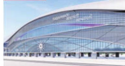
Mahatma Gandhi's charkha (spinning wheel)