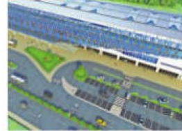
Diamonds hubs that connect communities'