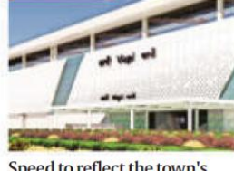
Speed to reflect the town's rapid industrialisation