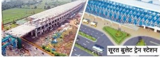
सूरत बुलेट ट्रेन स्टेशन