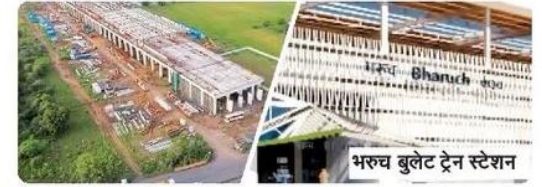
भरूच बुलेट ट्रेन स्टेशन