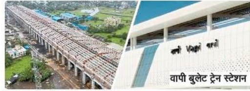
वापी बुलेट ट्रेन स्टेशन