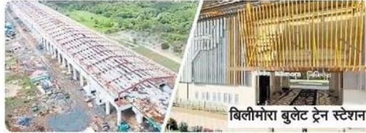
बिलीमोरा बुलेट ट्रेन स्टेशन