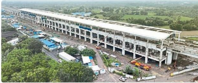
आणंद का निर्माणाधीन बुलेट ट्रेन स्टेशन

अहमदाबाद: यह स्टेशन शहर के समृद्ध सांस्कृतिक और